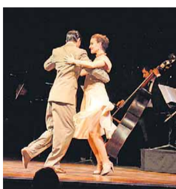
Criatividade. No El Querandí

El Querandí Não é tão intimista quanto o Bar